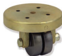
40-168 NPG 050 AML0