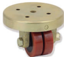
40-164 NPG 050 HPL0