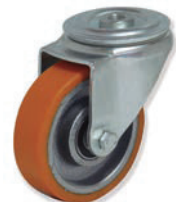
34-620 FTG4 080 HPB4