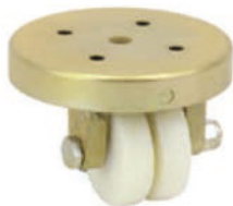
40-160 NPG 050 NYLO