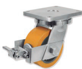
Rotante giratorio con freno